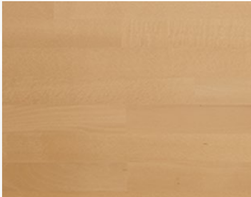
258 Rovere Oak Couleur rouvre Eichenholz Roble