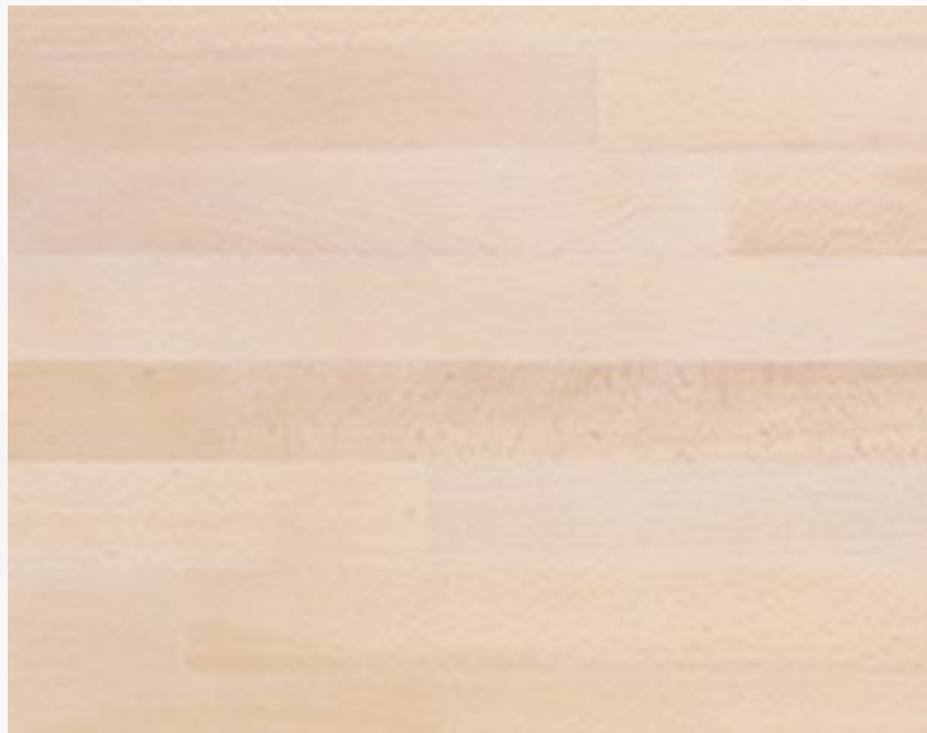
311 Sbiancato Whitened wood Blanchi Bleichesholz Madera blanqueada

La tonalité des couleurs est affectée par la vidéo qui n'assure pas une correspondance réelle, il est suggéré de les évaluer sur la base des échantillons réels disponibles au réseau de vente.