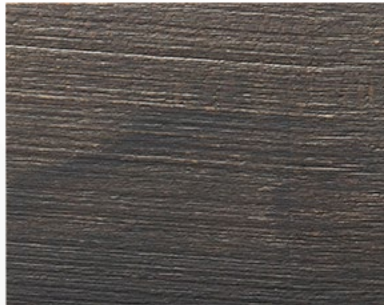
410 S Cacao spazzolato Cacao, brushed treatment Cacao, traitement brossé Kakao, Gebürstetes Behandlung Cacao, tratamiento cepillado