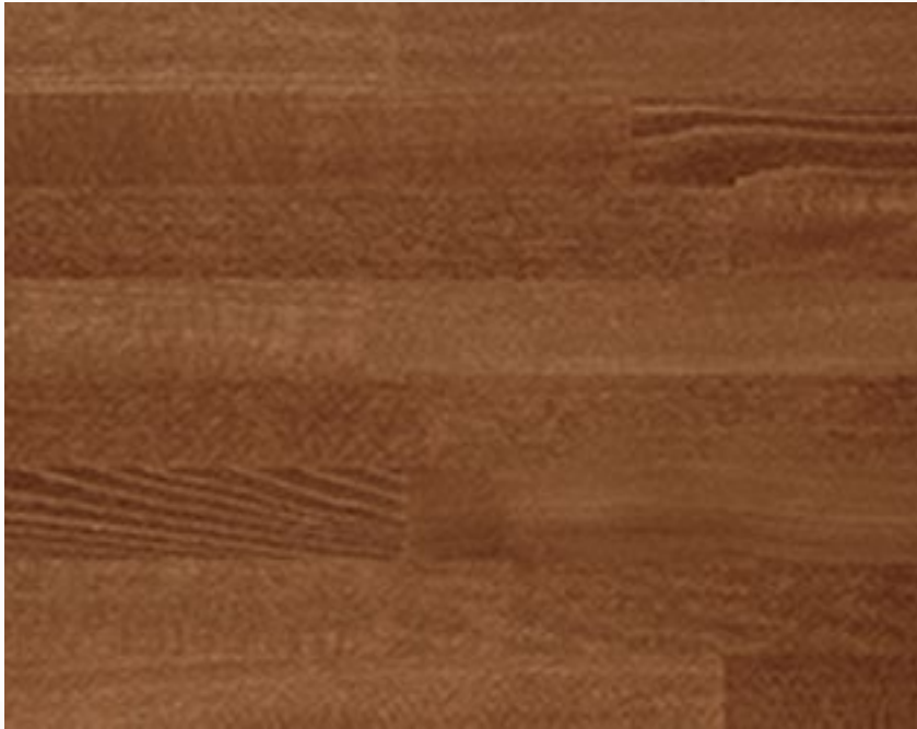
252 Noce medio Light chestnut Noyer moyen Nussbaumholz Nogal medio