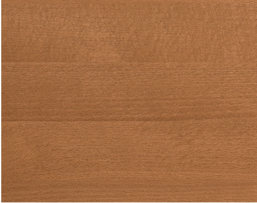
287 Ciliegio Cherry stain Couleur cerisier Kirschholz Color cerezo