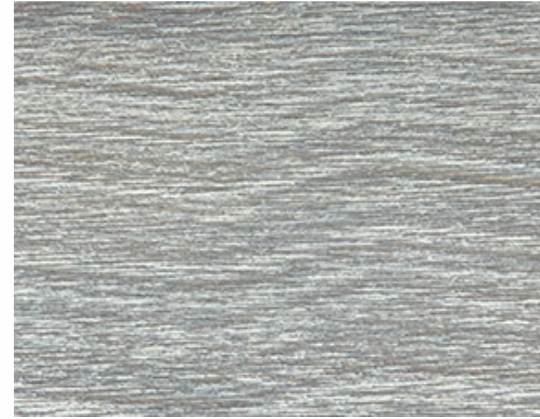
401 DEC Grigio decapato Grey Gris Grau Gris