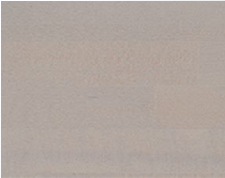
430 Tortora Dove grey Gris tourterelle Taubengrau Gris ceniciento