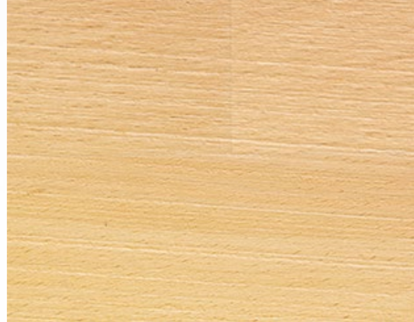
253S Naturale spazzolato Natural, brushed treatment Couleur naturelle, traitement brossé Naturbuchenholz, Gebürstetes Behandlung Natural, tratamiento cepillado