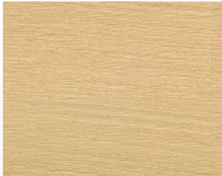
420S Sabbia spazzolato Sand, brushed treatment Sable, traitement brossé Sandfarben, Gebürstetes Behandlung Arena, tratamiento cepillado