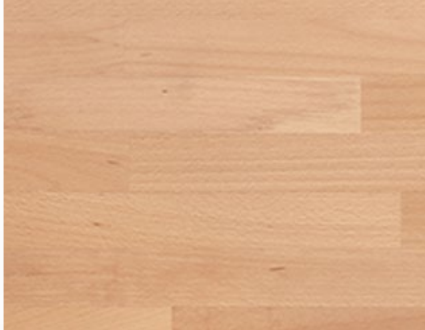
253 Naturale Natural Naturbuchenholz Couleur naturelle Natural