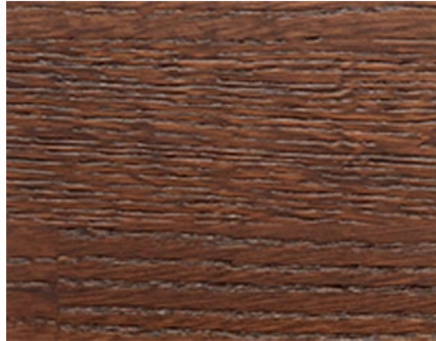
252 Noce medio, trattamento spazzolato Light chestnut, brushed treatment Noyer moyen, traitement brossé Nussbaumholz, Gebürstetes Behandlung Nogal medio, tratamiento cepillado