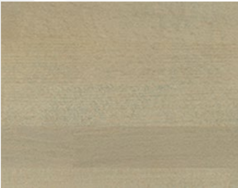
420 Sabbia Sand Sable Sandfarben Arena