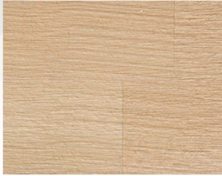
430S Tortora spazzolato Dove grey, brushed treatment Gris tourterelle, traitement brossé Taubengrau, Gebürstetes Behandlung Gris ceniciento, tratamiento cepillado