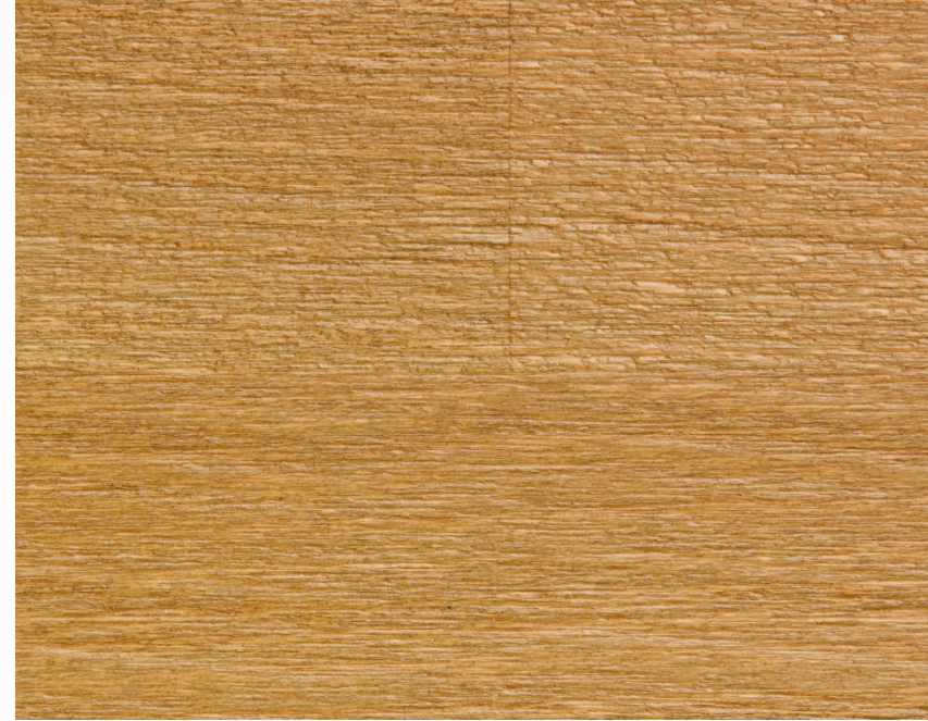
287 Ciliegio spazzolato Cherry stain, brushed treatment Couleur cerisier, traitement brossé Kirschholz, Gebürstetes Behandlung Color cerezo, tratamiento cepillado