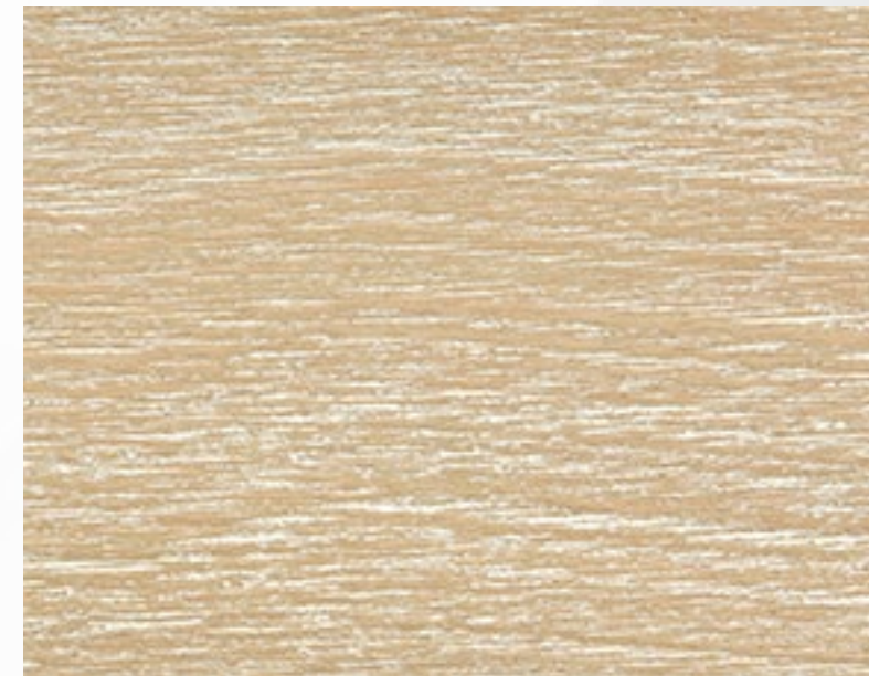
421 DEC Sabbia decapato Sand Sable Sandfarben Arena