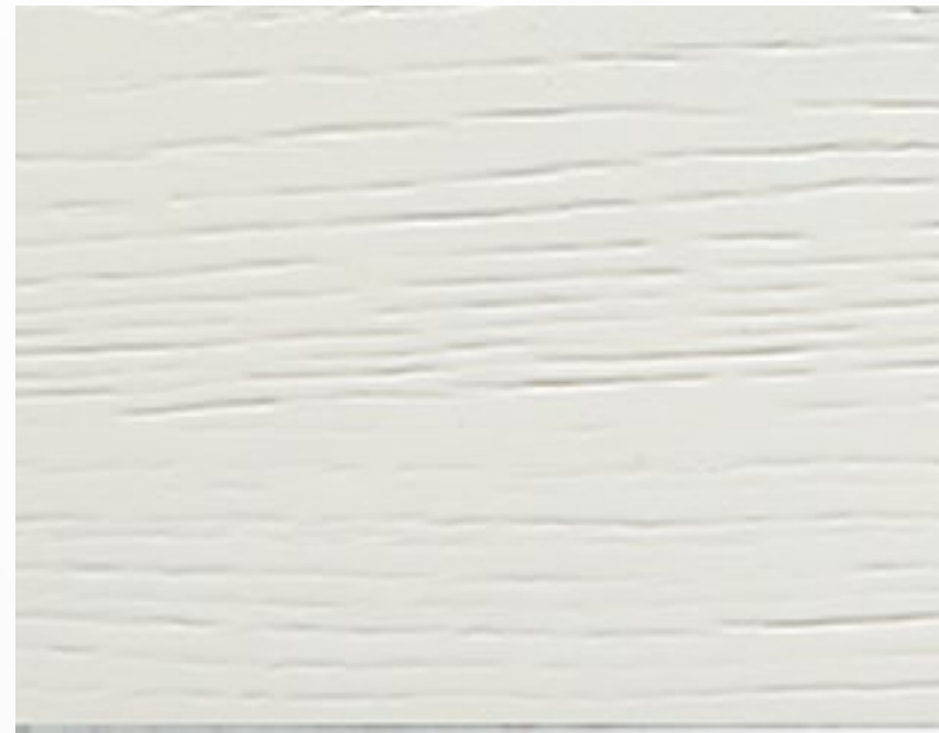
305S Bianco spazzolato White, brushed treatment Blanc, traitement brossé Weiß, Gebürstetes Behandlung Blanco, tratamiento cepillado