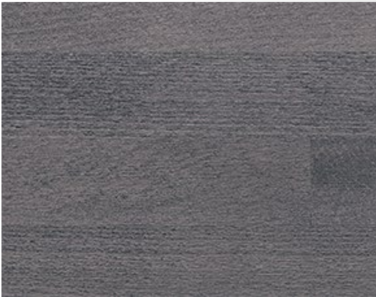
400 Grigio Grey Gris Grau Gris