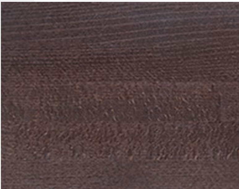
410 Cacao Cacao Cacao Kacao Cacao