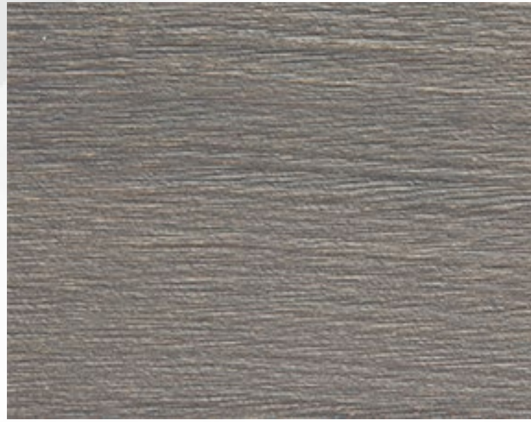
400S Grigio spazzolato Grey, brushed treatment Gris, traitement brossé Grau, Gebürstetes Behandlung Gris, tratamiento cepillado