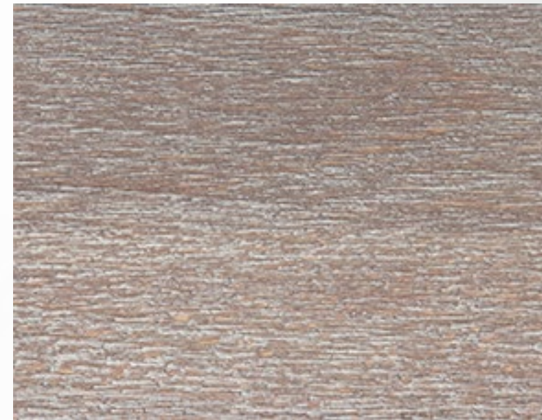
411 DEC Cacao decapato Cacao Cacao Kacao Cacao