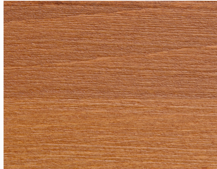
289 Doussiè spazzolato Doussiè, brushed treatment Doussiè, traitement brossé Doussiè, Gebürstetes Behandlung Doussiè, tratamiento cepillado