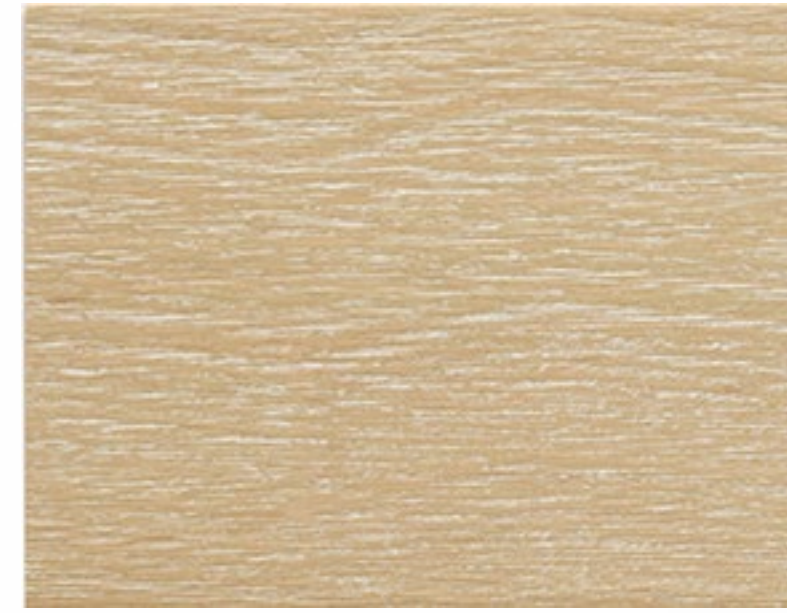
431 DEC Tortora decapato Dove grey Gris tourterelle Taubengrau Gris ceniciento