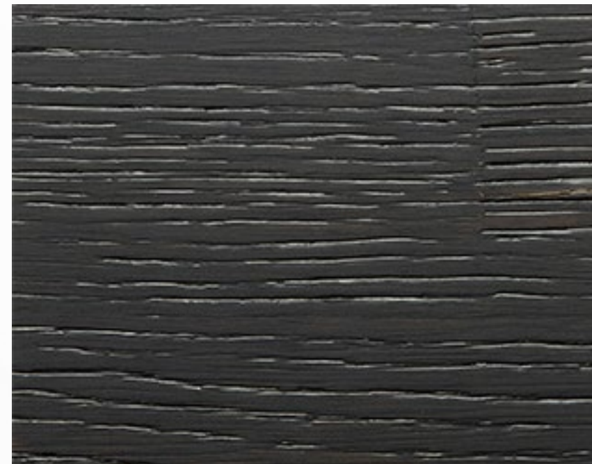
390S Nero spazzolato Black, brushed treatment Noir, traitement brossé Schwarz, Gebürstetes Behandlung Negro, tratamiento cepillado