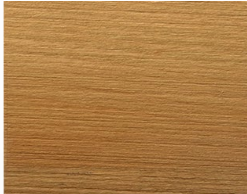
258S Rovere spazzolato Oak, brushed treatment Couleur rouvre, traitement brossé Eichenholz, Gebürstetes Behandlung Roble, tratamiento cepillado